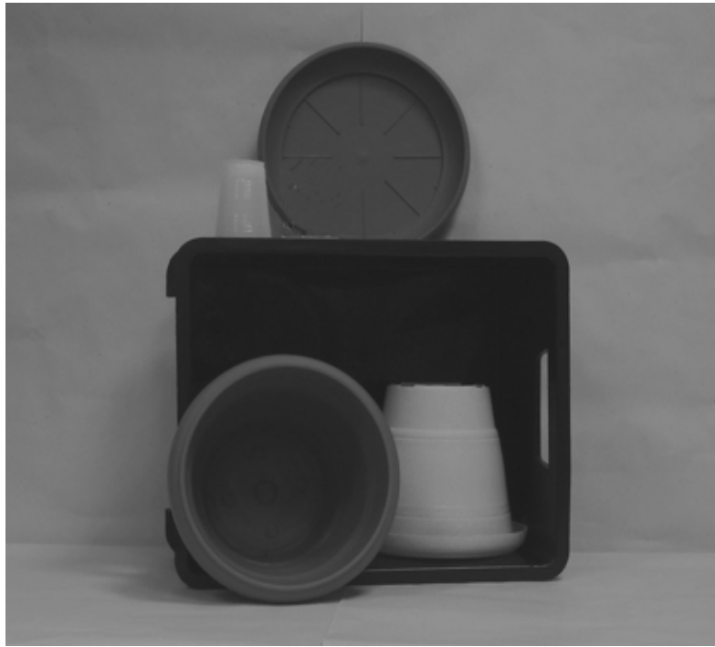
Πρώτη φωτογραφία : Μπροστινή όψη