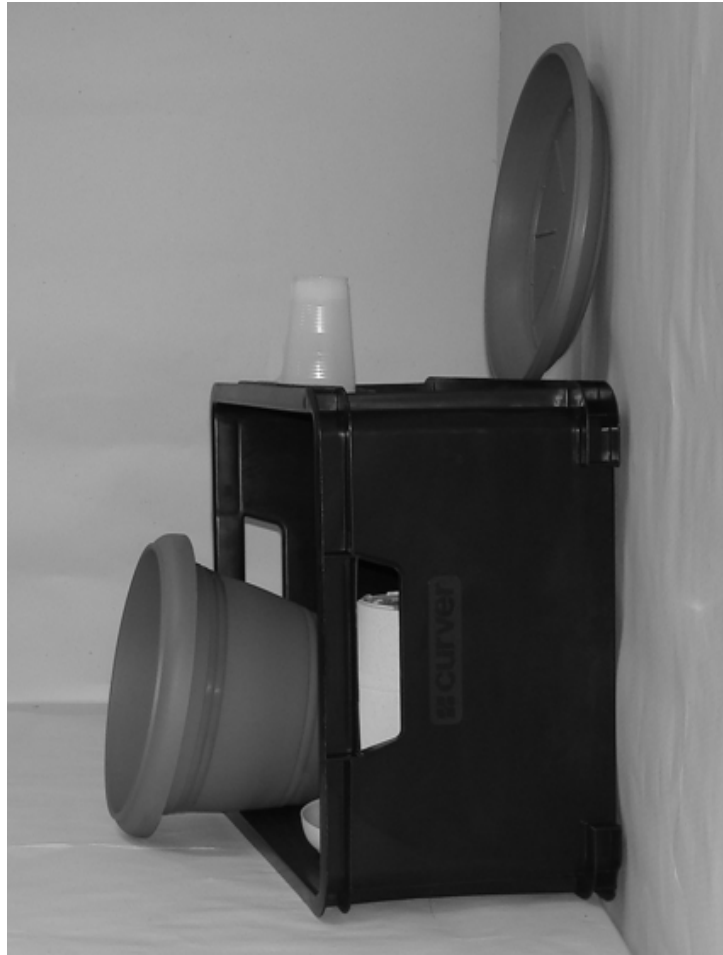
Τρίτη φωτογραφία : Πλάγια όψη