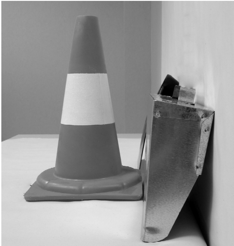
Τρίτη φωτογραφία : Πλάγια όψη