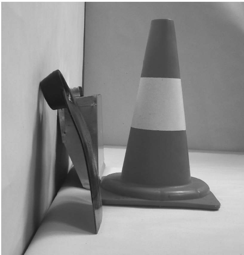
Τέταρτη φωτογραφία : Πλάγια όψη